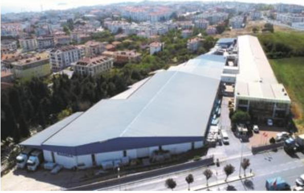
Beylikdüzü Boru Fabrikası